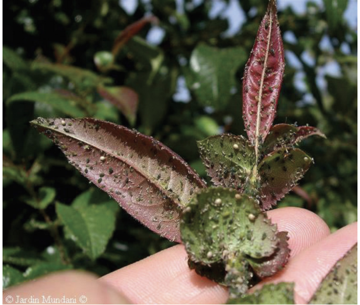
Figura 4-1. Pulgones en rosal. 111