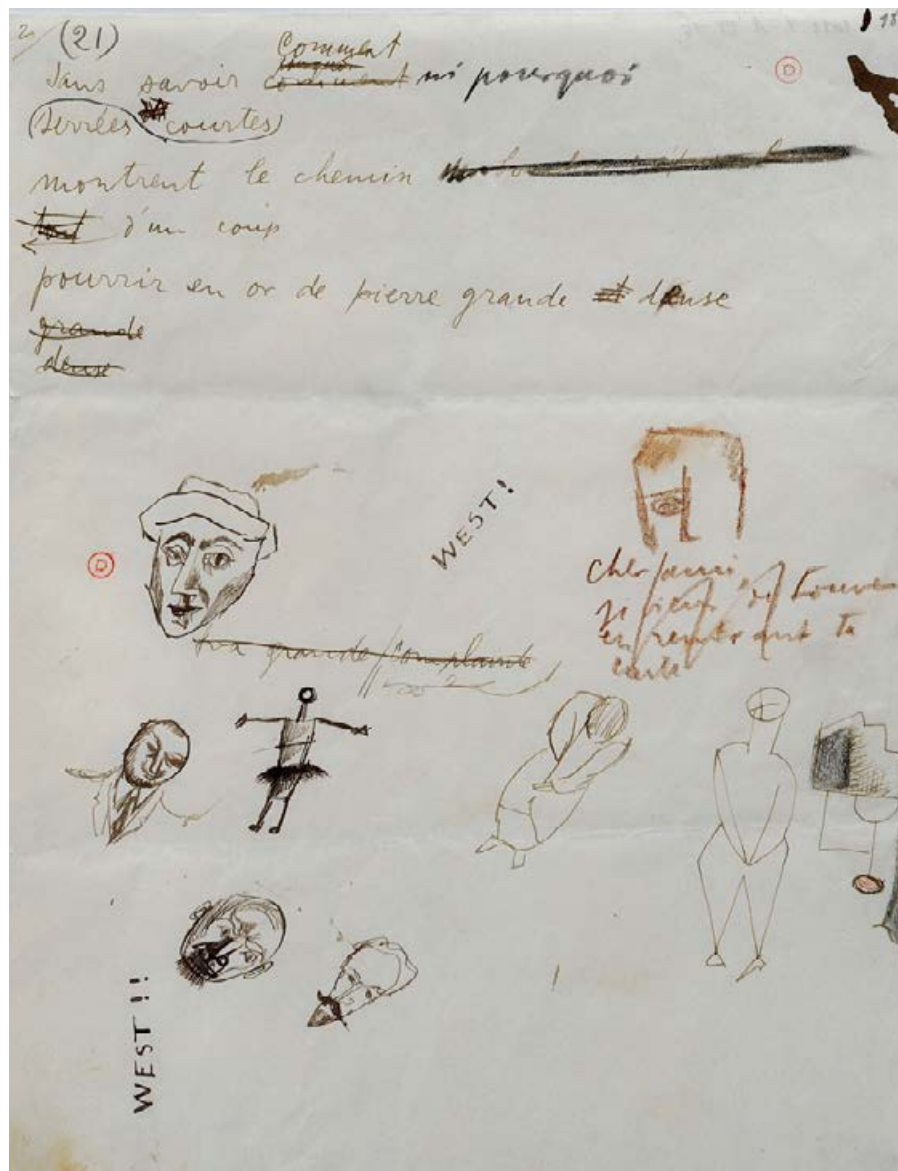
2. Borrador de Tristan Tzara (reverso). Biblioteca Jacques Doucet, París.