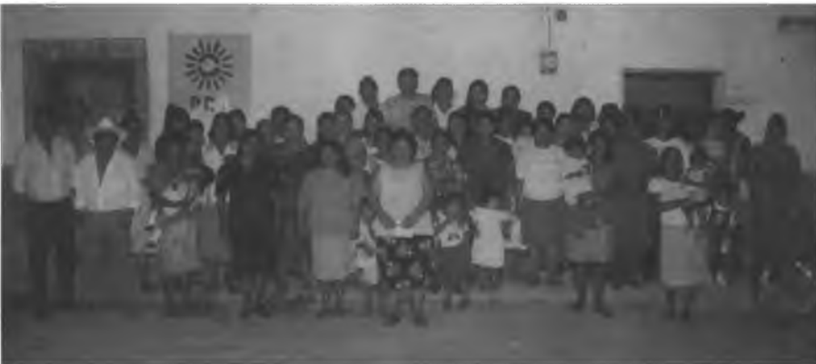
Grupo de mujeres de Nuevo Vicente Guerrero, municipio de La Concordia, 1998.