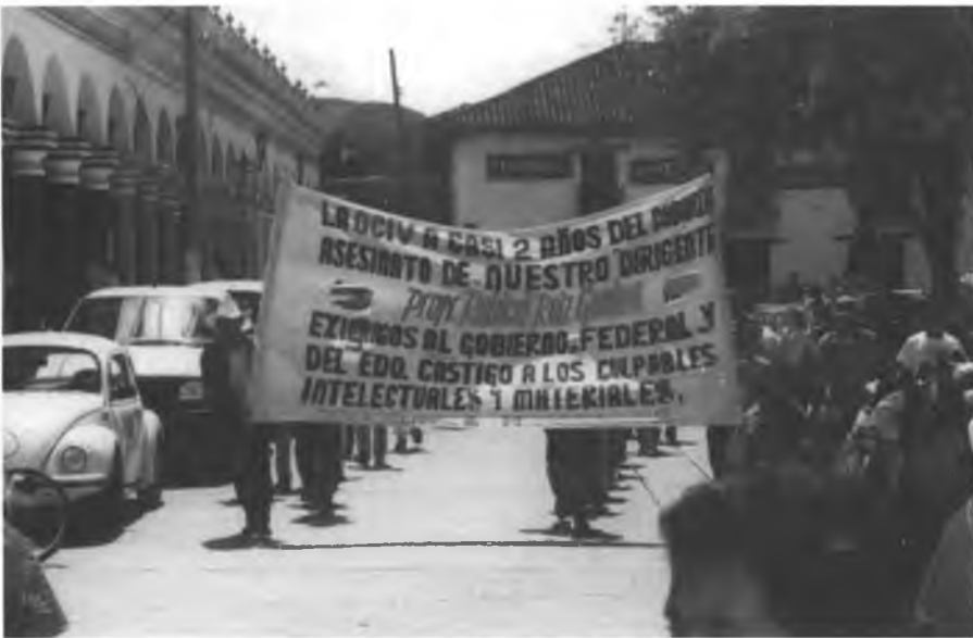
Participación de OCIV en la marcha anual de 12 de octubre. San Cristóbal de Las Casas, 1999.