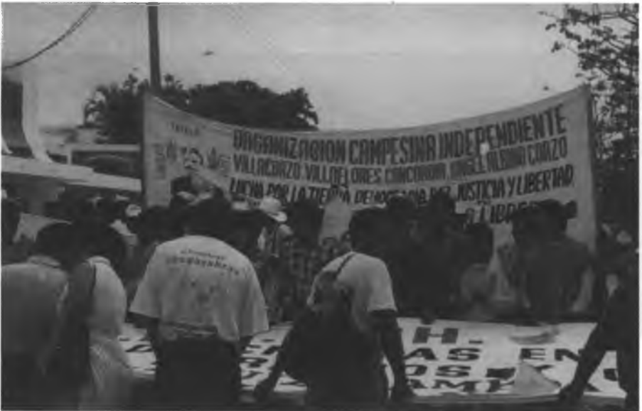
Preparativos de OCIV para ocupar lugar en marcha, Tuxtla Gutiérrez, 1998.