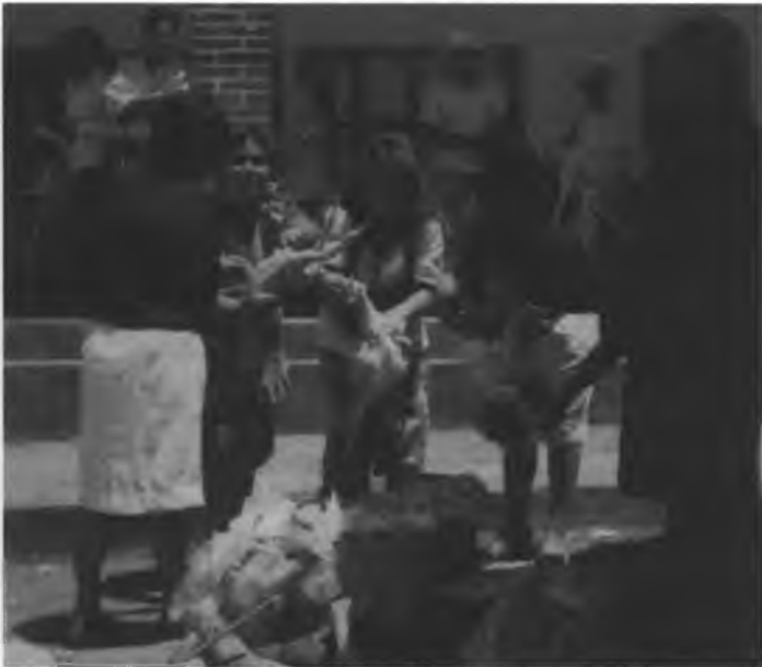
Actividad de mujeres en la toma de la presidencia de Villacorzo, marzo, 1995.