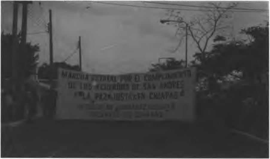
Cabecera de Marcha, Tuxtla Gutiérrez, 1998.