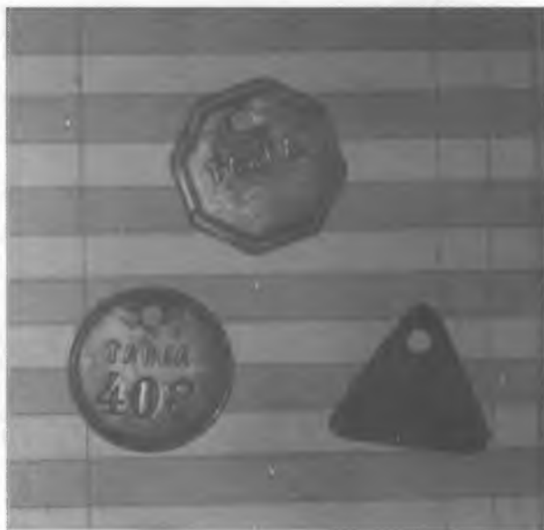
Ficha de pago por tarea usada en la finca Liquidámbar, municipio Ángel Albino Corzo, 1997.