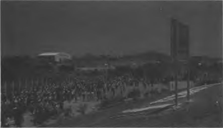
Marcha de la sociedad civil villacorcesa en demanda de la destitución del presidente municipal. Villacorzo, marzo, 1995.