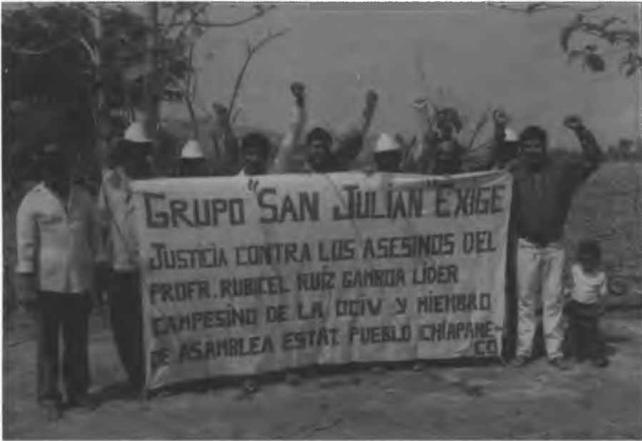
Grupo de San Julián, municipio de Villacorzo, 1998.